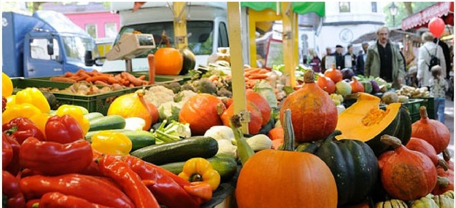
Le Wochenmarkt à Hamburg.

Secur'Food 7ème Congrès & Convention d'Affaires Sécurité des aliments & Traçabilité 29 & 30 novembre 2011